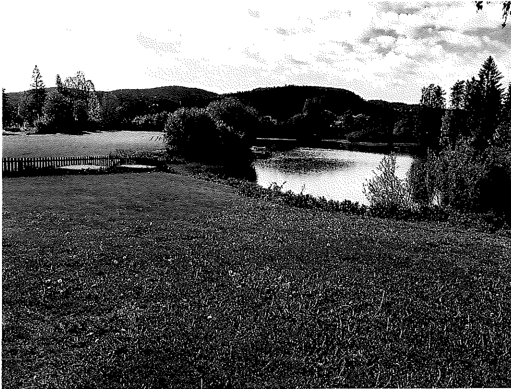
Dette er utsikten fra evt. et nytt minnesmerke / navnet urnelund.

Kirkevergen ser at kremering stadig blir mer aktuelt, også her i Nome. Ikke alle har familie i nærhet og en navnet minne/urnelund med minnesmerke er et flott alternativ til vanlig gravsted med eget gravminne. Dette er et tilbud Nome kommune må ha i begge sokn.